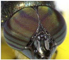
黄色粘着テープで捕獲